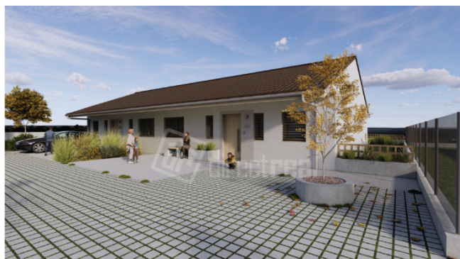
Vizualizácie projektu (pohľad na Bungalov s dvomi bytovými jednotkami) V i n o h r a d y