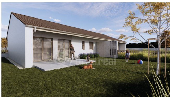
Vizualizácia projektu (pohľad na Bungalov B zo záhrady) Vinohrady nad Váhom