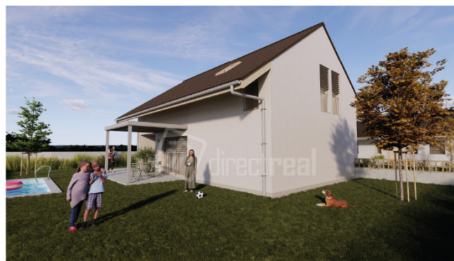
Vizualizácia projektu (poohľad na Rodinný dom zo záhrady) Vj n o.l.r