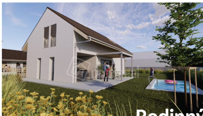
Vizualizácia projektu (poohľad na Rodinný dom zo záhrady) Vj n o.l.r

Novostavby Vinohrady nad Váhom/Samostatne stojaci rodinný dom